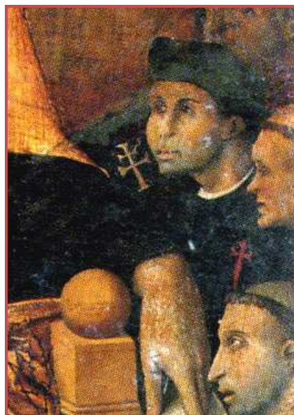
Figg. 3-4 - Pietro Cavaro (attr.), S. Agostino in cattedra , 1521 ca, Cagliari, Pinacoteca Nazionale; part. Ritratto di Salvatore Aymerich , signore di Mara, committente del Retablo di S. Giovanni Battista. ( www.sardegnaigitallibrary.it )