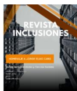
Vol. 7 Num Esp. Enero-Marzo 2020 Un Diálogo Andino-Caribe